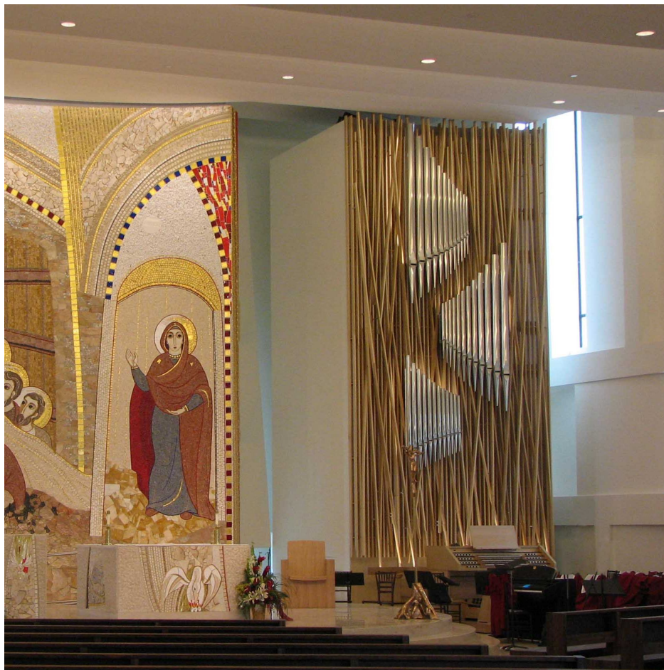
Design: Sasaki Associates & Didier Grassin